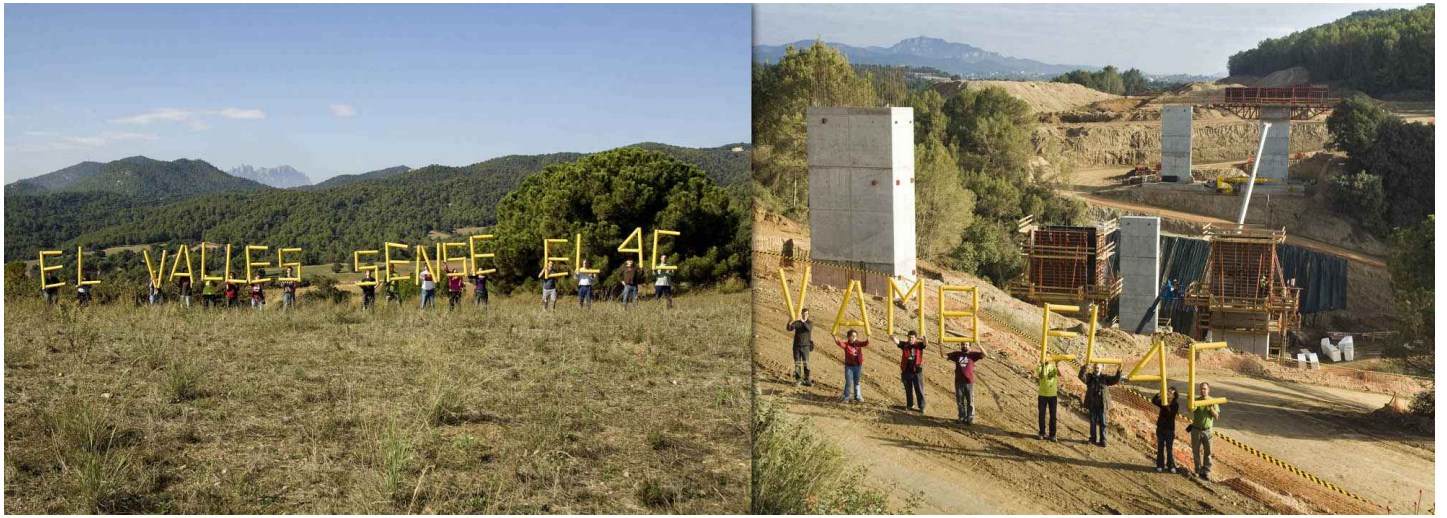
Terrassa - Viladecavalls