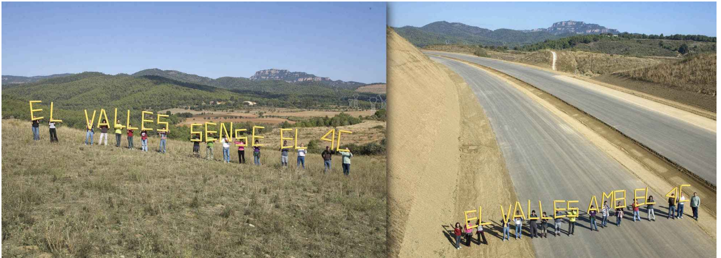
Terrassa - Terrassa